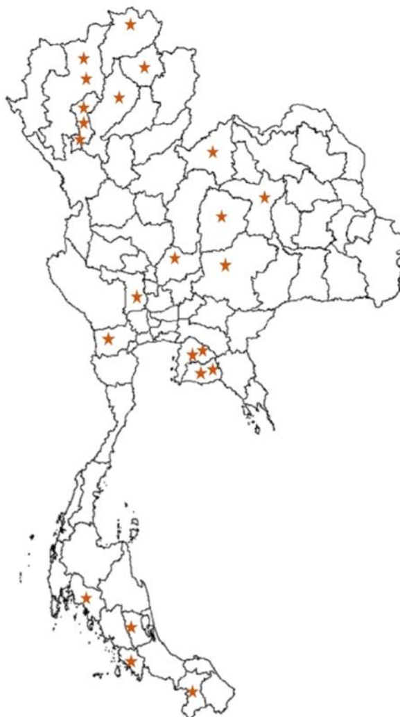
แผนภาพที่ 2.3 การกระจายตัวของเทศบาลตำบล ประเภททั่วไป ที่ผ่านเข้ารอบที่ 3

สำหรับรางวัลเทศบาลตำบล ประเภททั่วไป คณะอนุกรรมการกำหนดหลักเกณฑ์การจัดสรรเงินอุดหนุนเพื่อให้เป็น รางวัลสำหรับองค์กรปกครองส่วนท้องถิ่นกำหนดกำหนดให้ใช้ค่าคะแนน T-score เท่ากับ 56 คะแนนเป็นเกณฑ์คัดกรอง เทศบาลตำบล ประเภททั่วไปเข้าสู่รอบที่ 3 ซึ่งจากเกณฑ์ดังกล่าวทำให้มีเทศบาลตำบลที่เข้ารอบจำนวน 23 แห่ง โดยเทศบาล ตำบลมีคะแนน T-score สูงสุด คือ เทศบาลตำบลยางนึ่ง อ.สารภี จ.เชียงใหม่ (T-score = 73.42) และเทศบาลตำบลที่มี คะแนน T-score ต่ำสุด คือ เทศบาลตำบลบ้านดอน อ.อุทุมพร จ.สุพรรณบุรี (T-score = 56.77) โดยส่วนใหญ่เทศบาล ตำบล ประเภททั่วไปที่ผ่านเข้ารอบกระจุกตัวอยู่ในเขตภาคเหนือ (อัครณณ์ วงศ์ปรีดี และ ชัชเฉลิม สุทธิพงษ์ประชา, 2562ข: 1-2)